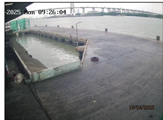
รูปที่ 2-13 ระบบกล้องวงจรปิด CCTV