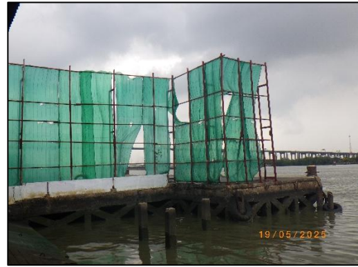
รูปที่ 2-7 การควบคุมการฟุ้งกระจายของฝุ่นละออง ขณะขนถ่ายสินค้า