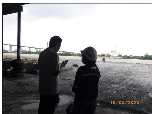
รูปที่ 2-1 การติดตามตรวจสอบการปฏิบัติตามมาตรการฯ ระหว่างเดือนมกราคม-มิถุนายน พ.ศ. 2568 โดย Third party ร่วมกับผู้แทนจาก บริษัท ร่มขุนไทย จำกัด