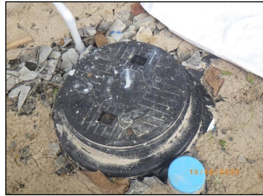
รูปที่ 2-2 ห้องสุขาและจุดติดตั้งบ่อเกรอะ บริเวณหลังโกดังพักรับสินค้า