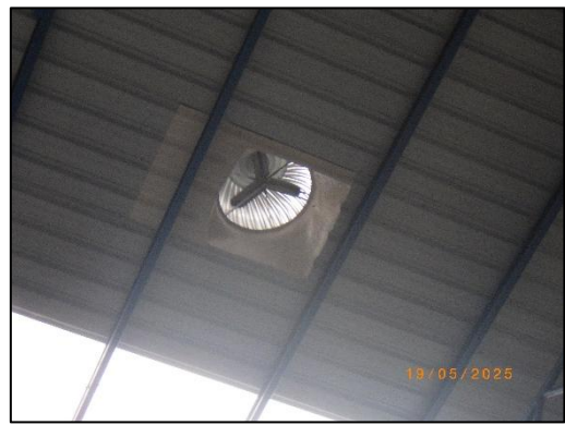
รูปที่ 2-8 ระบบระบายอากาศบนหลังคาของโกดังพักสินค้า