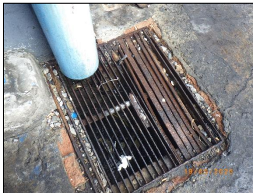
รูปที่ 2-11 ท่อระบายน้ำทิ้งภายในพื้นที่โครงการ